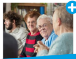
AIDE AUX AIDANTS