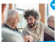
AIDE ET ACCOMPAGNEMENT À DOMICILE

Nos intervenants vous proposent des services personnalisés adaptés à vos besoins