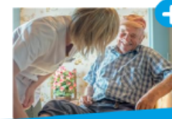
SOINS À DOMICILE