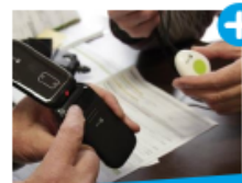
TÉLÉASSISTANCE FILIEN ADMR