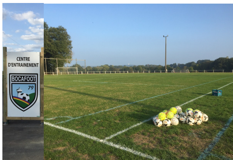
Stade de La Petite Boissière, centre d'entraînement commun à toutes les catégories