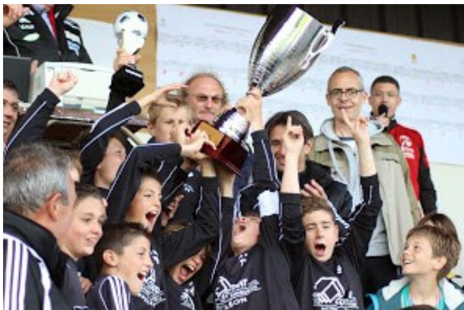
Les U13, victorieux au tournoi des Herbiers en 2014